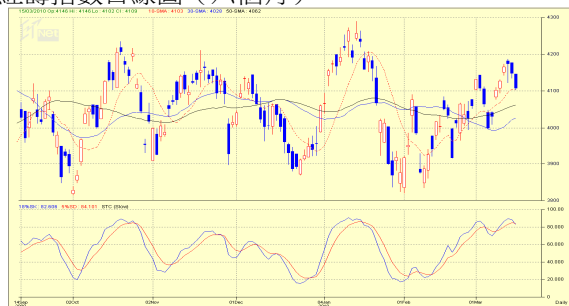
紅籌指數日線圖（六個月）