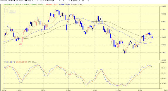
國企指數日線圖 (六個月)